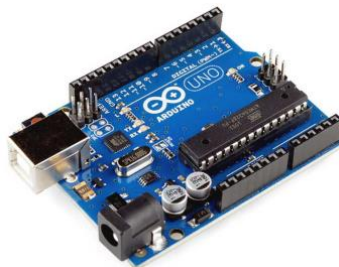
Gambar 2. Arduino Uno

Arduino Uno dapat diaktifkan melalui koneksi USB atau dengan catu daya eksternal. Sumber daya dipilih secara otomatis. Untuk sumber daya Eksternal (non- USB) dapat berasal baik dari adaptor AC- DC atau baterai. Adaptor ini dapat dihubungkan dengan memasukkan 2.1mm jack DC ke colokan listrik board. Baterai dapat dimasukkan pada pin header Gnd dan Vin dari konektor daya (Fatimang, 2022).